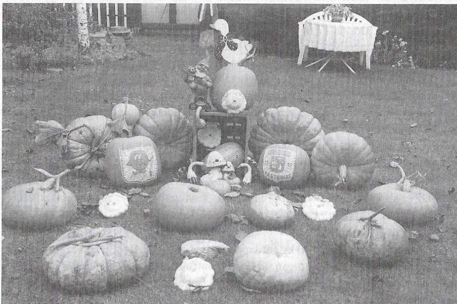
Pompoenen in de meest diverse vormen, maten en kleuren sieren dezer dagen het straatbeeld en de tuinen.