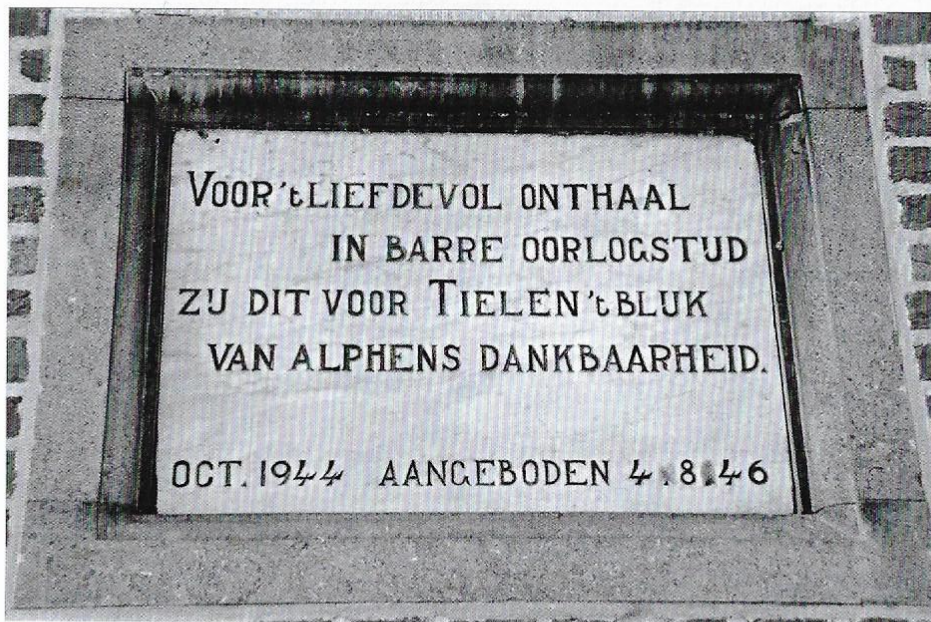
Gedenksteen in de zijgevel van het Tielense erfgoedhuis.

Aangezien de vlucht uit Alphen reeds 75 jaar geleden is zijn de meeste contacten ondertussen verwaterd. Op zondag 20 oktober 11. uitte het Alphenese herdenkingscomité van WO-II nogmaals de uitgesproken dankbaarheid van de vluchtelingenfamilies door de organisatie van een groots evenement op de markt van Turnhout. Contacten tussen (de nakomelingen van) de gastfamilies en van hun Nederlandse gasten van weleer werden bestendig of hernieuwd.