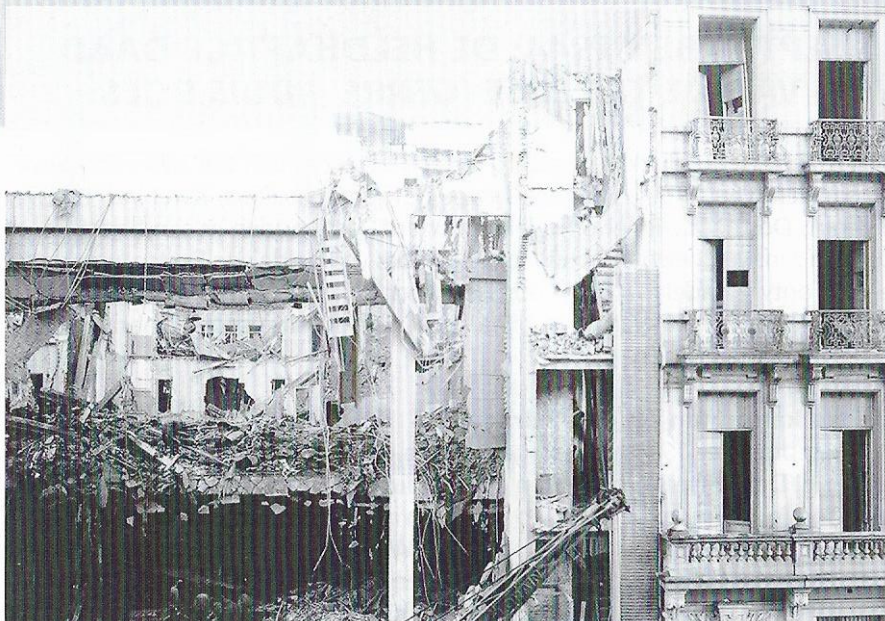
Het resultaat van die ene V2 op cinema REX