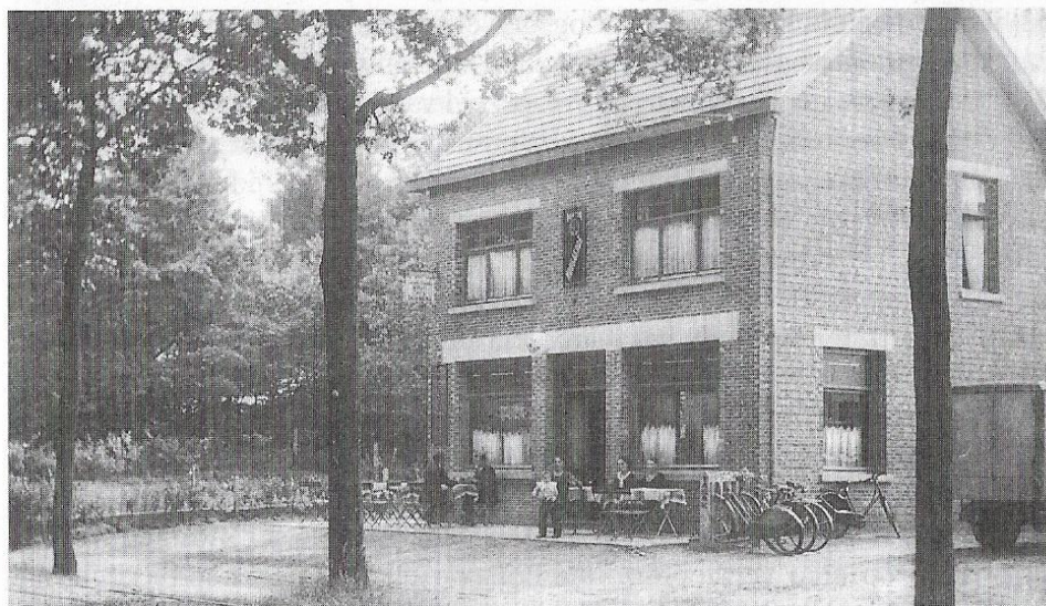
oudere foto van pension 'De Bergen' langs de "Geelsche steenweg".